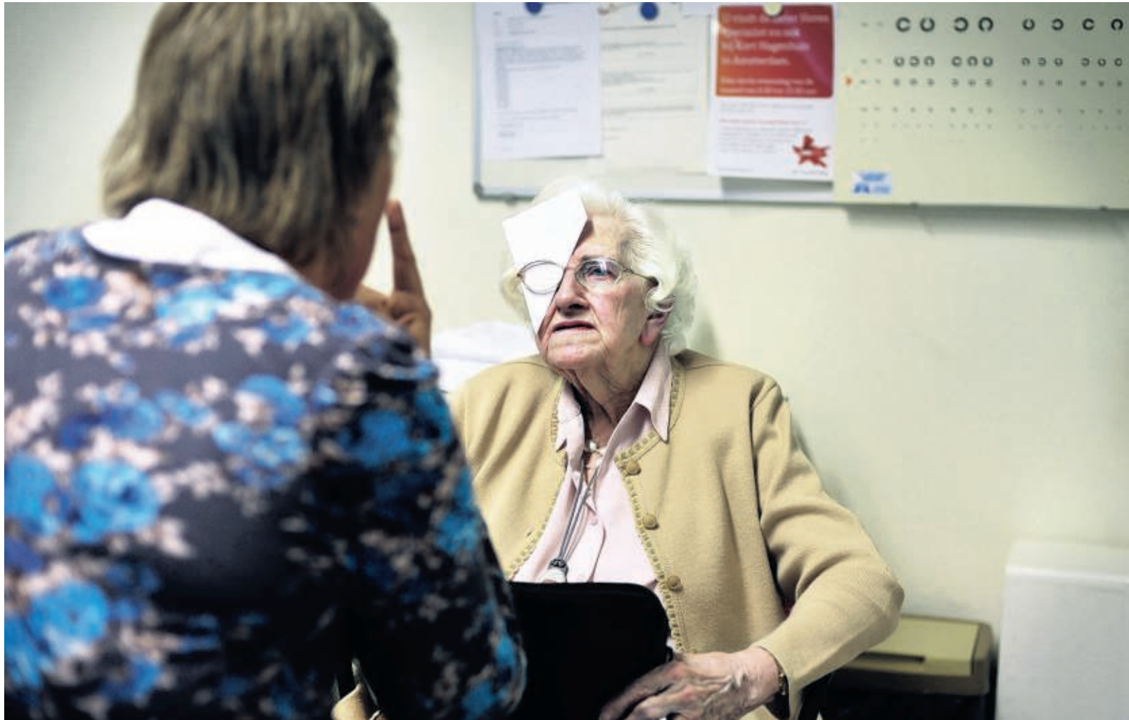
Een vrouw ondergaat een oogtest in het Eveen Korthagenhuis in Amsterdam-Noord.